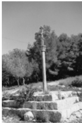
La Creu de Ribes

El camí arriba a la riera de Santa Bàrbara, una zona coneguda com "la Creu", i que constituirà el centre dels futurs barris de la Plana i Santa Bàrbara. Ara, de moment, encara veiem camí de terra, i l'agafem a l'esquerra, en direcció cap als elevats edificis de Santa Bàrbara. Després d'una breu pujada, arribem a la Creu de Ribes , per la que alguns sitgetans reclamen restauració. La carena, que ve de Vallpineda i segueix per la nostra esquerra, és el límit entre els termes municipals de Sitges i Sant Pere de