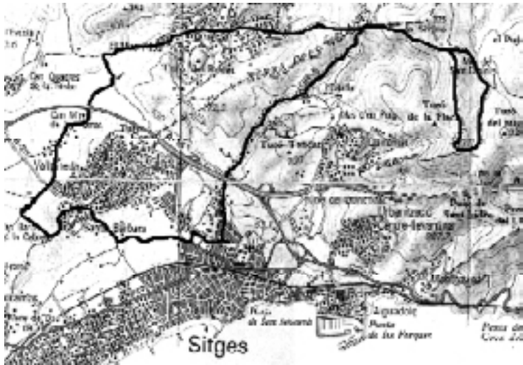
Mapa Garraf -17 (ICC)