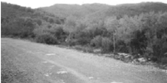
El Puig d'en Boronet des de la pista de Mas Alba

Mas Alba , evitant, en la mesura del possible, l'asfalt. Mas Alba, amagada darrera la serra dels Gegants, és una urbanització lletja, amb moltes cases a mig fer. Després de les edificacions, continuem amunt, per anar a buscar el Coll de la Fita . Arribats al Coll, veiem el Puig d'en Boronet a la dreta, i per on baixarem. I aquí, menjarem la ja tradicional coca.