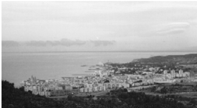
Sitges, des del Puig d'en Boronet